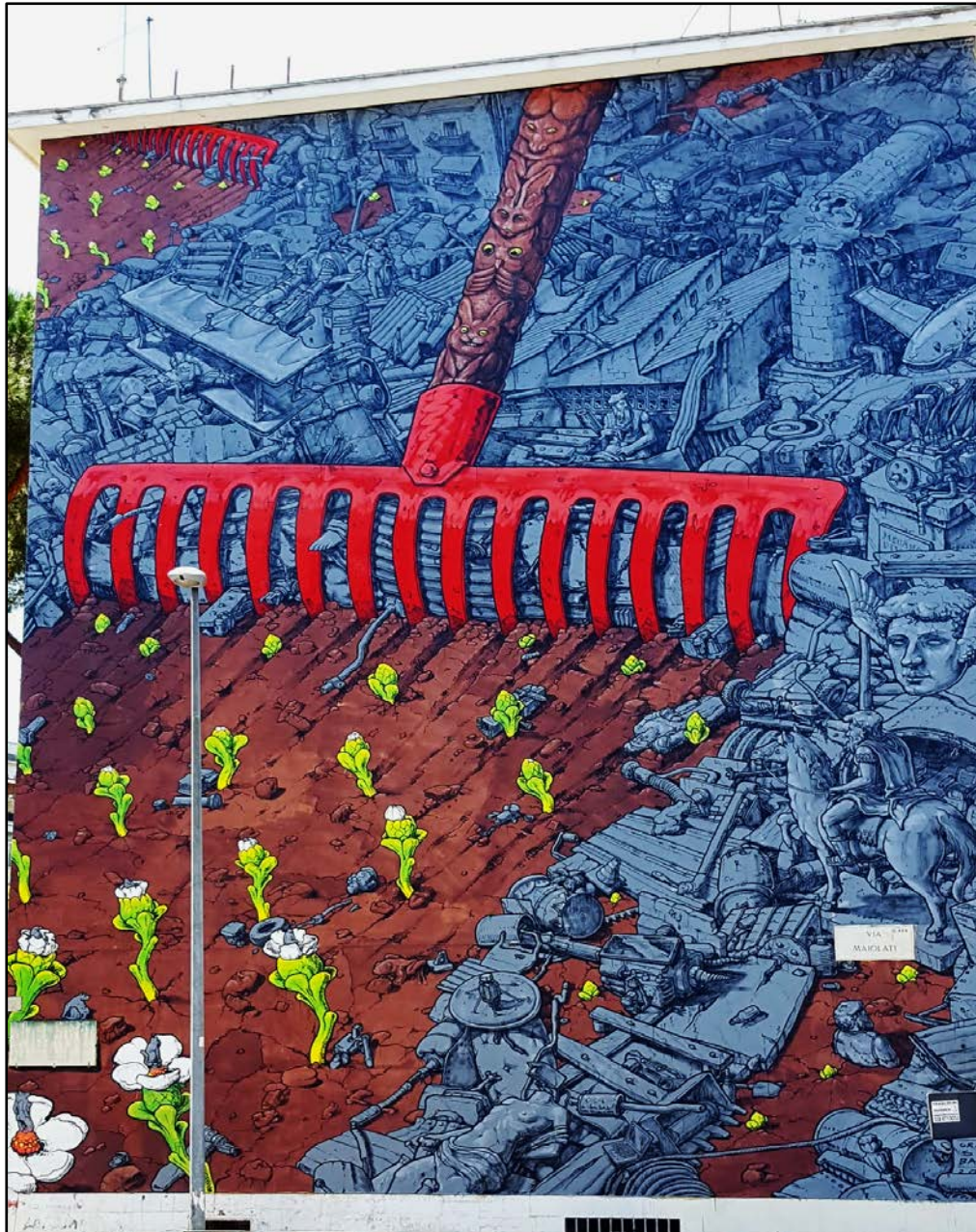
Un rastrello chiamato Nativa - 'Renacer' di Liqen a San Basilio, Roma

talmente forte da dimenticarsi di se stessi, da giocare fuori dalle regole del mercato e mettere in campo più energia di quanta le persone stesse di Nativa potessero recuperare. A volte il lavoro di Nativa avvantaggiava proprio le P Corp. Tuttavia la potenza di questa semplice idea era esplosa nel 2016, aveva trascinato inizialmente poche decine, poi centinaia e migliaia di altri imprenditori e persone in ogni ambito. Uno tsunami che aveva iniziato ad autoalimentarsi e non si era più fermato.